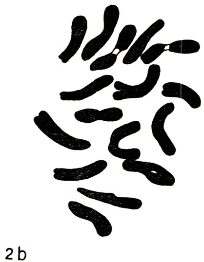
Cromosomi in metafase di Astragalus sirinicus (1 a e 1 b) e di Astragalus calabrus (2 a e 2 b).